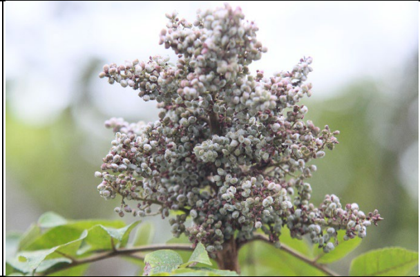
植物照-羅氏鹽膚木