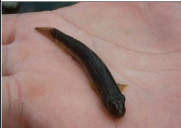
生物照-日本瓢鰭鰕虎