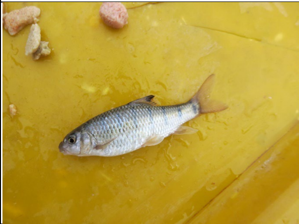
生物照-臺灣石魚賓